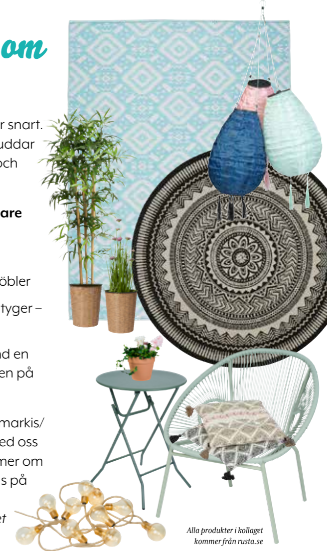
Alla produkter i kollaget kommer från rusta.se