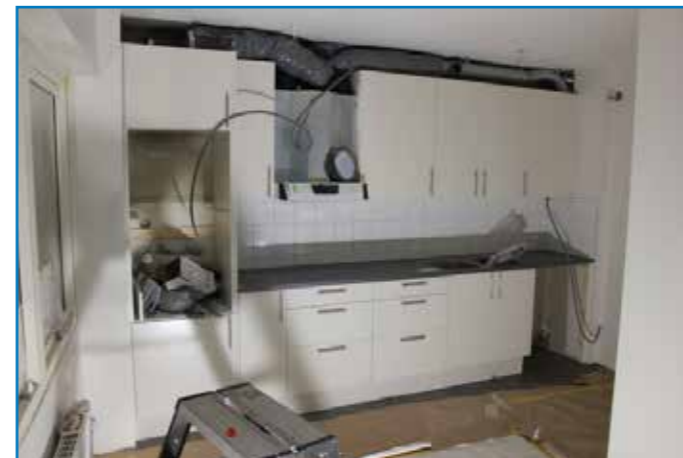
Dörren till tvättstugan/badrummet är borttagen, och i den här lägenheten det blir en hel kyl och en hel frys samt inbyggd ugn, microvågsugn och spishäll.