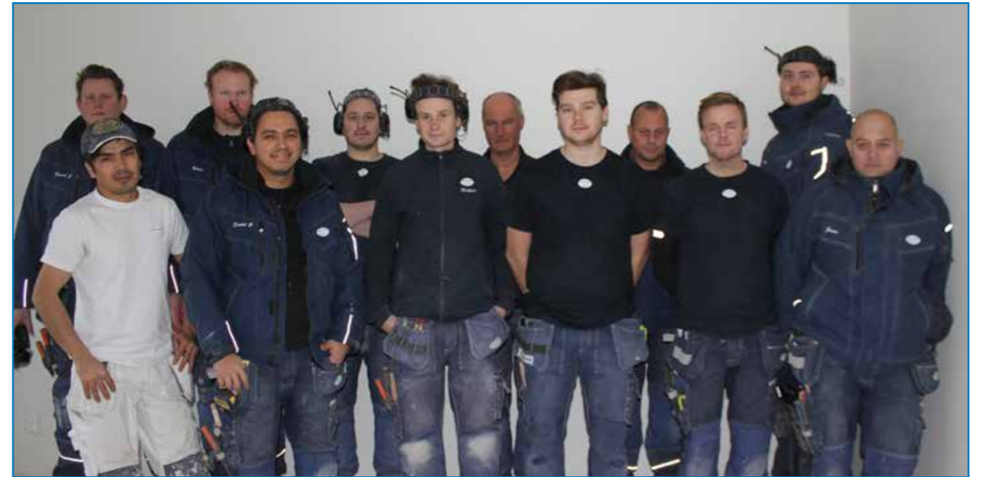
På bilden ser ni vårt ROT-team som utför renoveringen av Regnbågen.