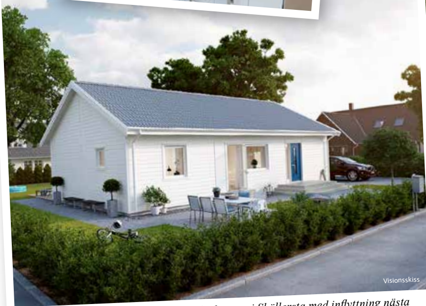
Åtta enplansvillor av den här typen ska byggas i Sköllersta med inflyttning nästa sommar.