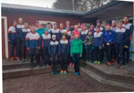
Julafton 2016. Före julmaten passade det här gänget på att springa en tur till klubbstugan.