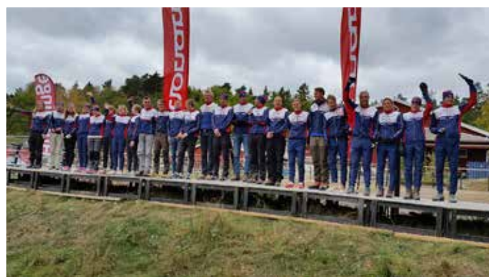
OK Tisarens lag – bestående av ungdomar, elit och äldre, både kvinnor och män – blev femma i 25-mannastafetten i Stockholm i höstas i konkurrens med cirka 350 startande lag.

– Då kommer pengarna väl till pass, men vi måste givetvis skjuta till eget ideellt arbete också.